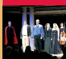
Ensemble „Oper im Taschenbuch- format“